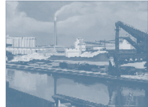
Precisionist Charles Sheeler modelleerde zijn American Landscape , 1930, naar de Fordfabriek bij River Rouge in Detroit